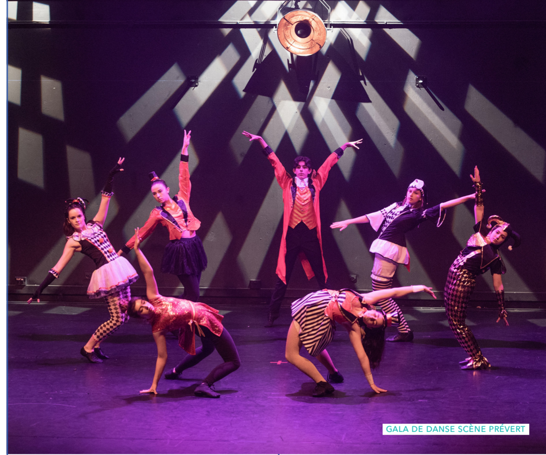
GALA DE DANSE SCÈNE PRÉVERT

29 M€ obtenus pour la réhabilitation des résidences Pinson et Espérance 10 M€ investis pour rénover et rendre accessible les bâtiments publics 41 M€ dédié à l'action sociale chaque année