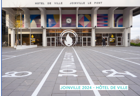
JOINVILLE 2024 - HÔTEL DE VILLE

3 827 inscrits à La Bibli et 91 000 prêts/ an 11 000 Spectateurs Scène & Cinéma Prévert