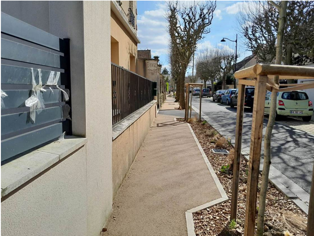
Rue Etienne Pégon